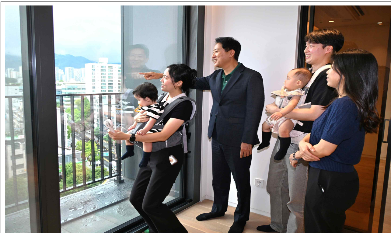
사진3. 오세훈 서울시장이 13일(수) 송파구 문정동에 위치한 '비아파트형 미리내집'을 함께 방문한 서울 베이비 엠버서더와 주택 주변 환경을 둘러보고 있다.