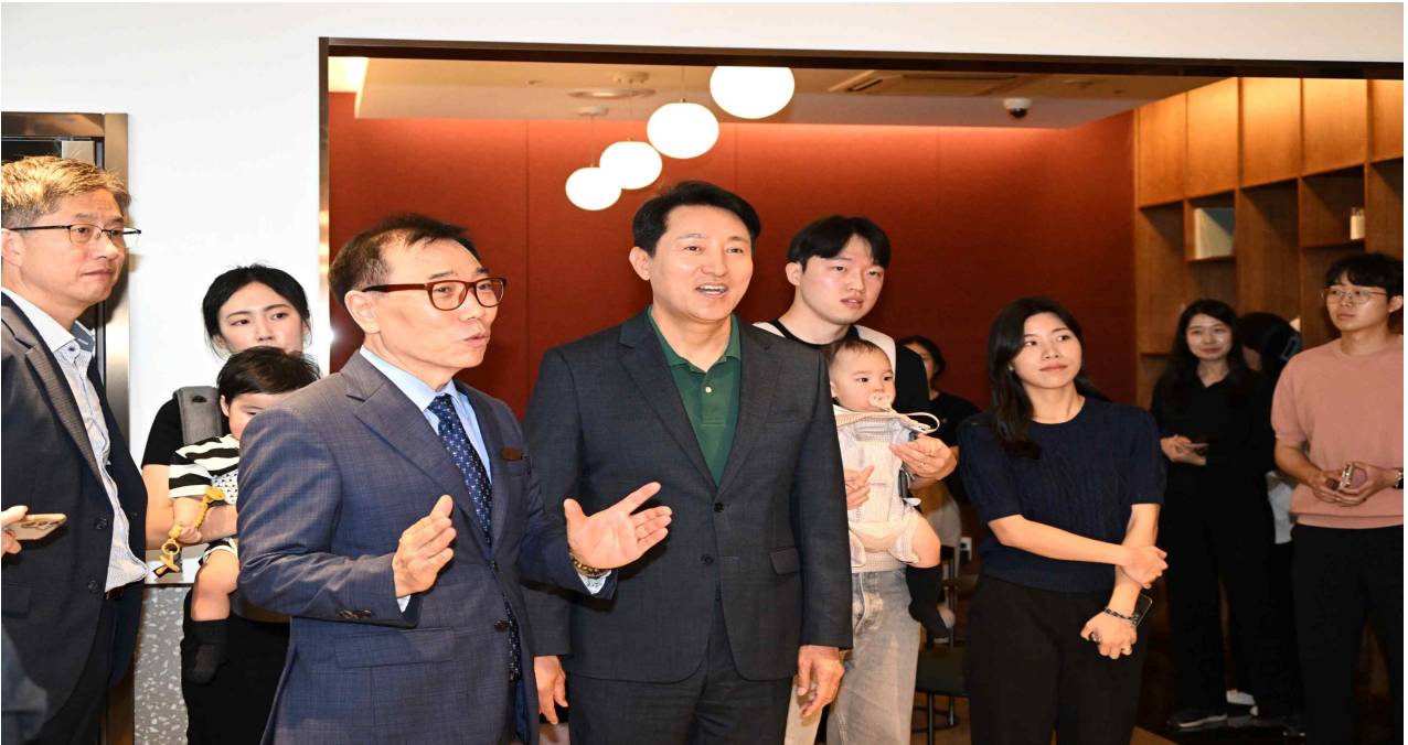
사진1. 오세훈 서울시장이 13일(수) 송파구 문정동에 위치한 '비아파트형 미리내집'을 함께 방문한 서울 베이비 엠버서더와 커뮤니티센터 내부를 둘러보고 있다.