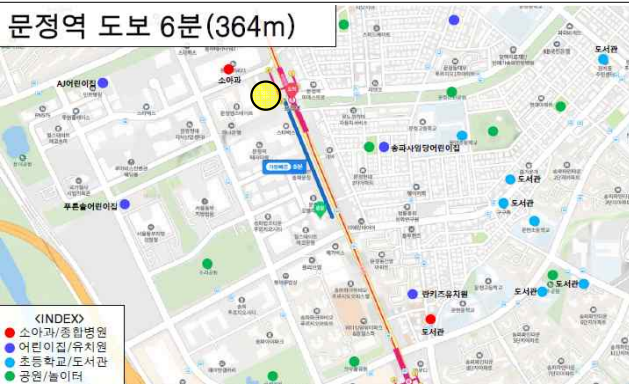
문정역 도보 6분(364m)