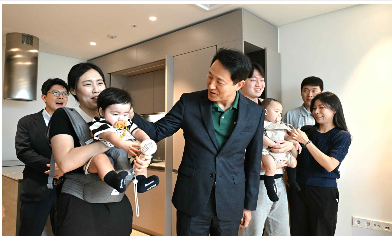
사진4. 오세훈 서울시장이 13일(수) 송파구 문정동에 위치한 '비아파트형 미리내집'을 함께 방문한 서울 베이비 엠버서더와 대화 나누고 있다.