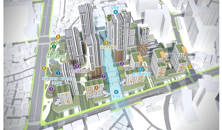
<종합구상도> 도시에 순응하며 걷고, 보고 이웃과 어우러져 즐거움이 있는 열린 단지