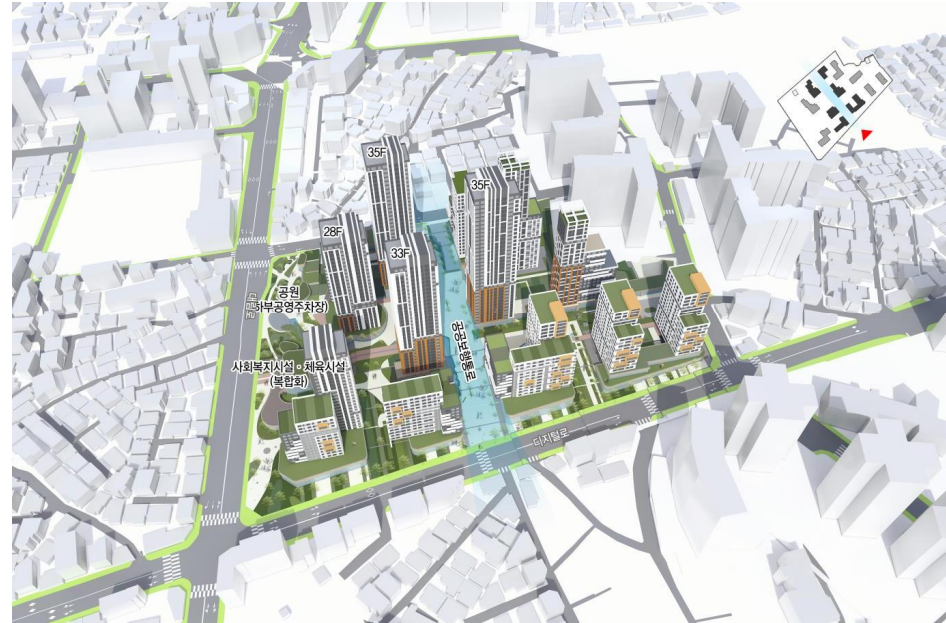
<단지배치 계획안②> 대상지 남북측 주거지 및 등갓길과 연계되는 공공보행통로 조성