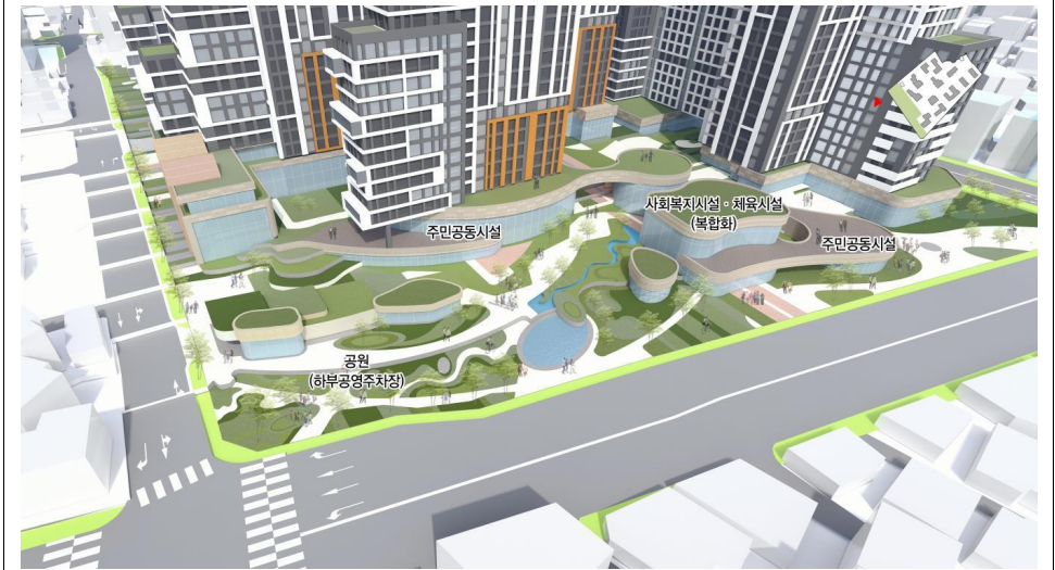
<단지배치 계획안④> 디지털로 변 가로대응형 진입경관 형성