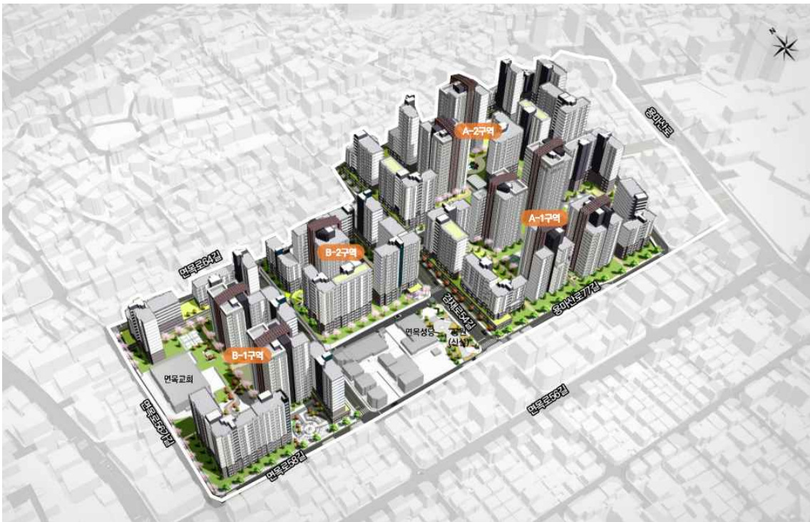
조 감 도 (정비 후)