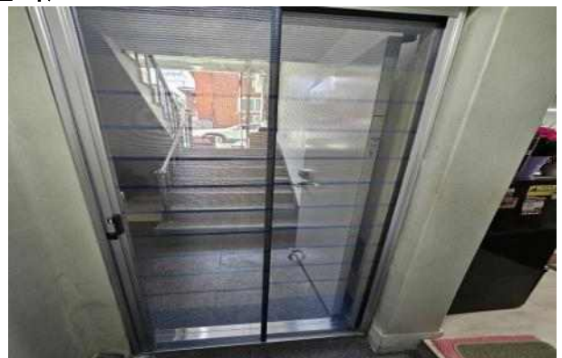
〈반지하 주택 현관 방충망 설치〉