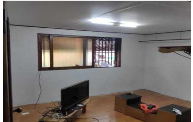
〈벽면 및 천장 도배〉